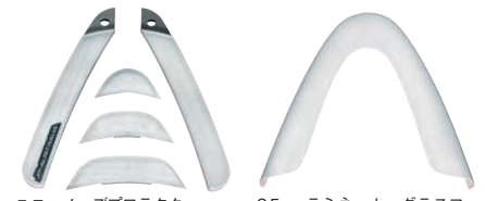
ユニ・ノーズプロテクター JP EVA製ノーズプロテクター ユニセッ ¥11,550 (税込) 2.5mmラミネート・グラスファ イバー製ノーズプロテクター ¥12,600 (税込)

大切なボードを守るためのノ ーズプロテクター。ユニセッ トはJPボードに限らず、あ らゆるボードに装着できま す。グラスファイバー製のプロ テクターは、JPの各モデルに 合わせたグラフィックが施さ れ、形状もジャストフィット。